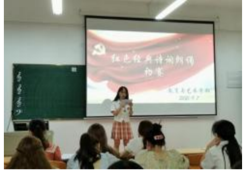
▲教育与艺术学部诗歌朗诵初赛现场

(教育与艺术学部)为弘扬中华优秀传统文化，激发当代大学生对中华诗词的认同与热爱，引导青年学子以诗歌为载体学习感悟百年党史，同时提高同学们的专业技能，营造良好的文化氛围，丰富大学课余生活，2021年9月7日晚18:30，教艺术学部于实验楼一栋406多媒体教室举办红色经典诗词朗诵活动。