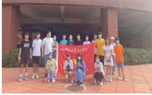
▲高职一学部迎新志愿者合影

晚上七点，活动开始。首先，全体起立，所有与会同学齐唱中国共产主义青年团团歌。随后，各班主持人带领同学们回顾了党的光辉革命奋斗历史，讴歌了党的百年丰功伟绩。最后，同学们观看习近平总书记“七一”重要讲话相关视频，进一步激发同学们的爱国奋斗热情。活动过程中氛围热烈，大家积极