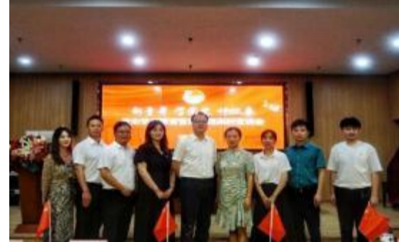
▲领导嘉宾们合影留念

教育动员大会上的重要讲话精神，促进了我校学子理想信念的坚定与思想共识的凝聚，展现出我校对党史学习教育的走深走实、入脑入心。